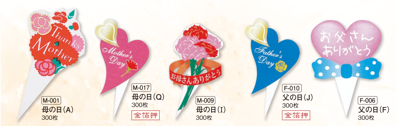
M-001 母の日(A) 300枚