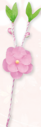
アート桃 Y 1輪(ピンク軸)