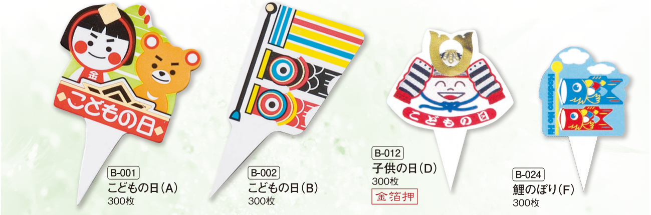
B-001 こどもの日(A) 300枚