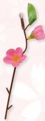
新アート桃 2輪(ポリ軸)