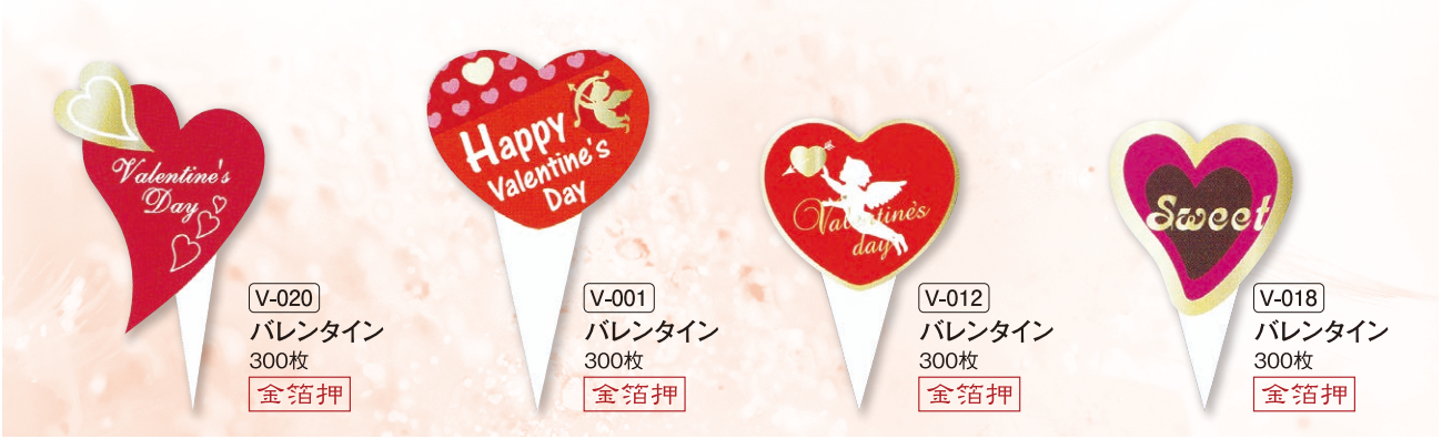
V-020 バレンタイン 300枚 金箔押