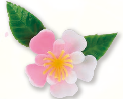
ミニ桜(ピンクツートン)