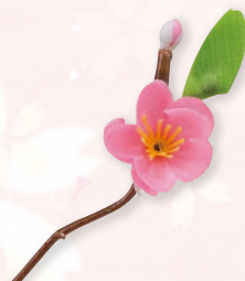
新アート桃 1輪(ポリ軸)