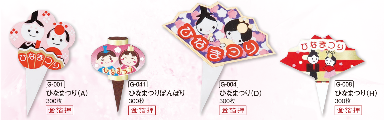
G-001 ひなまつり(A) 300枚 金箔押