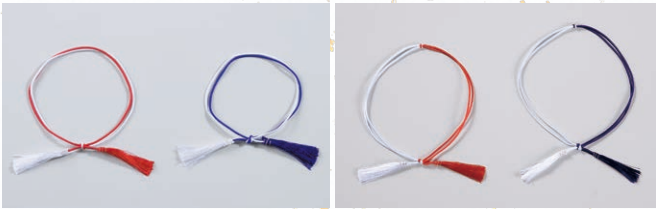
紅白二重 紫白二重 紅白二重 振り分け 紫白二重 振り分け