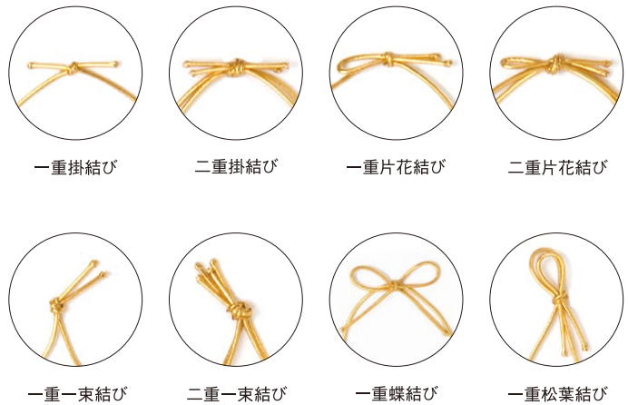
一重掛結び 二重掛結び 一重片花結び 二重片花結び 一重一束結び 二重一束結び 一重蝶結び 一重松葉結び