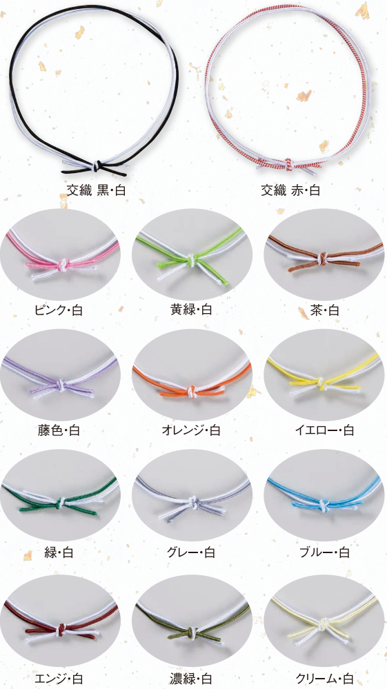
交織 黒・白 交織 赤・白 ピンク・白 黄緑・白 茶・白 藤色・白 オレンジ・白 イエロー・白 緑・白 グレー・白 ブルー・白 エンジ・白 濃緑・白 クリーム・白